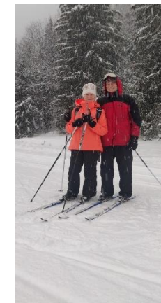
Ski de fond aux Contamines en janvier 2021

La retraite est bien occupée car nos 4 enfants et leur conjoint et nos 9 petits-enfants nous sollicitent souvent, pour notre plus grand bonheur, même si certains habitent très loin (Singapour). Nous aimons visiter des pays étrangers, jouer au bridge et faire du sport - avec l'âge j'ai dû abandonner le volley-ball pour me reconvertir dans des sports plus doux : gymnastique ou ski de fond.