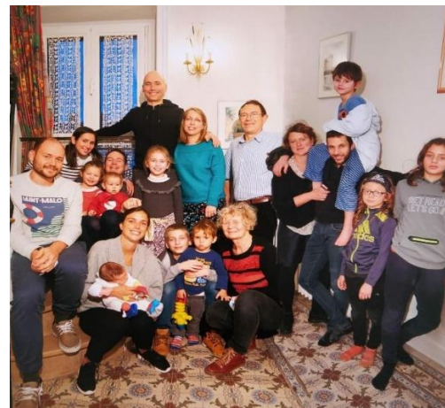
Noël 2020 : les grands-parents (au centre) heureux de rassembler toute la famille dans leur maison de Saint-Fons

Ma motivation et mon plaisir dans les activités du CPU viennent du fait que j'ai connu la difficulté de travailler en anglais, malgache ou espagnol et que je trouve passionnant d'analyser pourquoi on s'exprime de telle ou telle manière dans sa propre langue, ce que je pratique aussi au Secours catholique de Vénissieux. Les moments formidables d'hospitalité que j'ai connus de la part de bien plus pauvres que moi en Afrique me conduisent à accueillir chaleureusement ceux qui viennent séjourner chez nous.