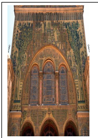
La grande mosquée de Damas