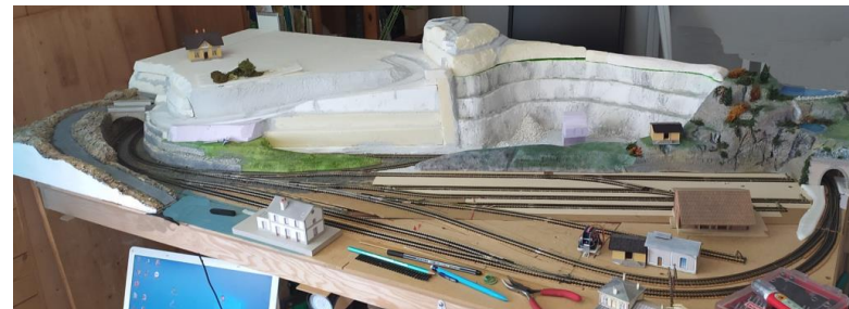
Maquette en cours de réalisation (il y a encore beaucoup de travail)

Même si l'informatique occupe une grande partie de mon temps, je me consacre aussi au bricolage et un peu au modélisme ferroviaire. Le modélisme est un univers où je peux créer, adapter, transformer les accessoires recherchés (mini moteurs, maisons, décors etc.), c'est un lieu qui donne libre cours à mon imagination.